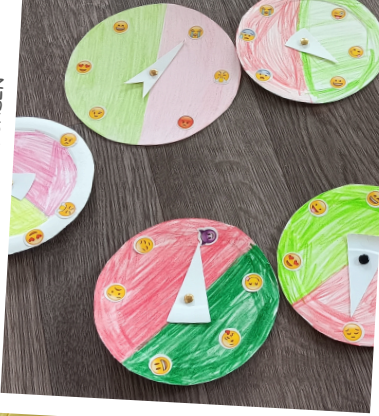
IMPRESSIONEN AUS DEN KURSEN